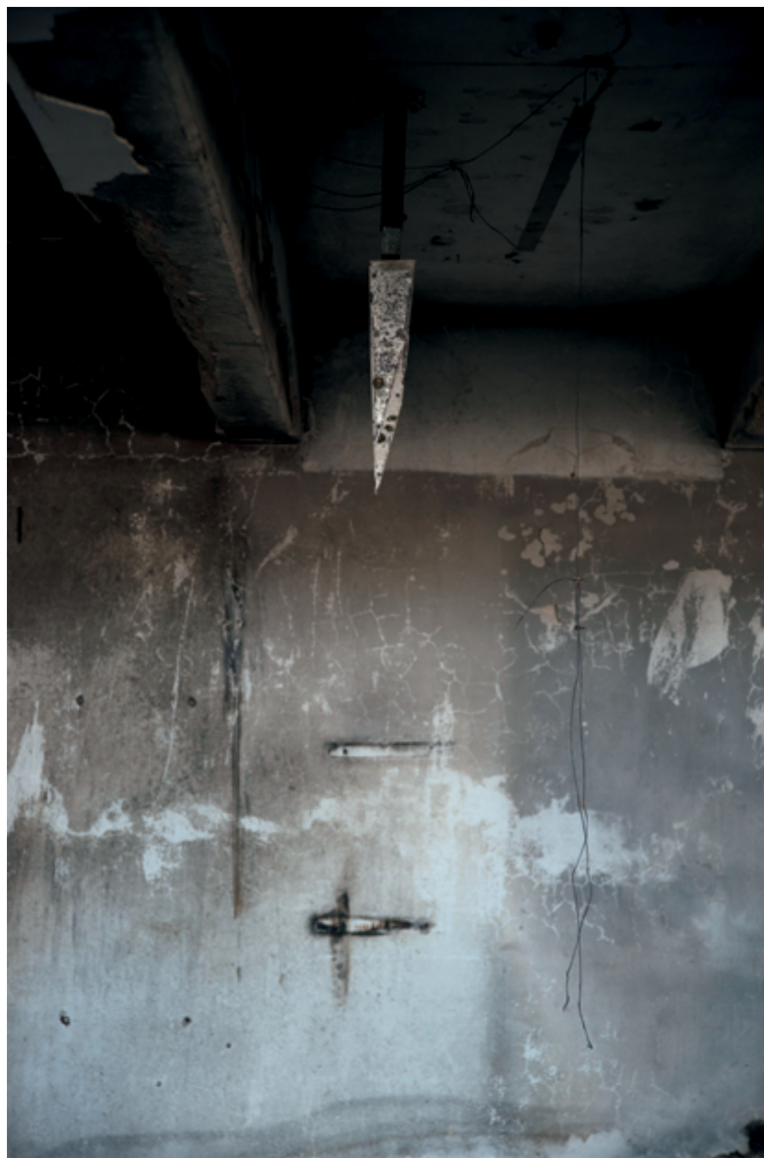
דבי מורג, להב משונן (2017), צילום, 100/70 ס"מ Debbie Morag, Jagged Blade (2017), photograph, 70/100 cm