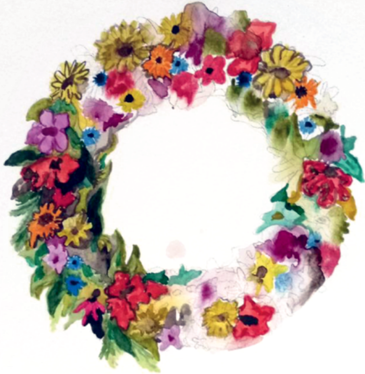
מיכל רובנס, זר (2017), צבעי מים על נייר, 24/32 ס"מ Michal Rubens, Bouquet (2017), watercolor on paper, 24/32 cm