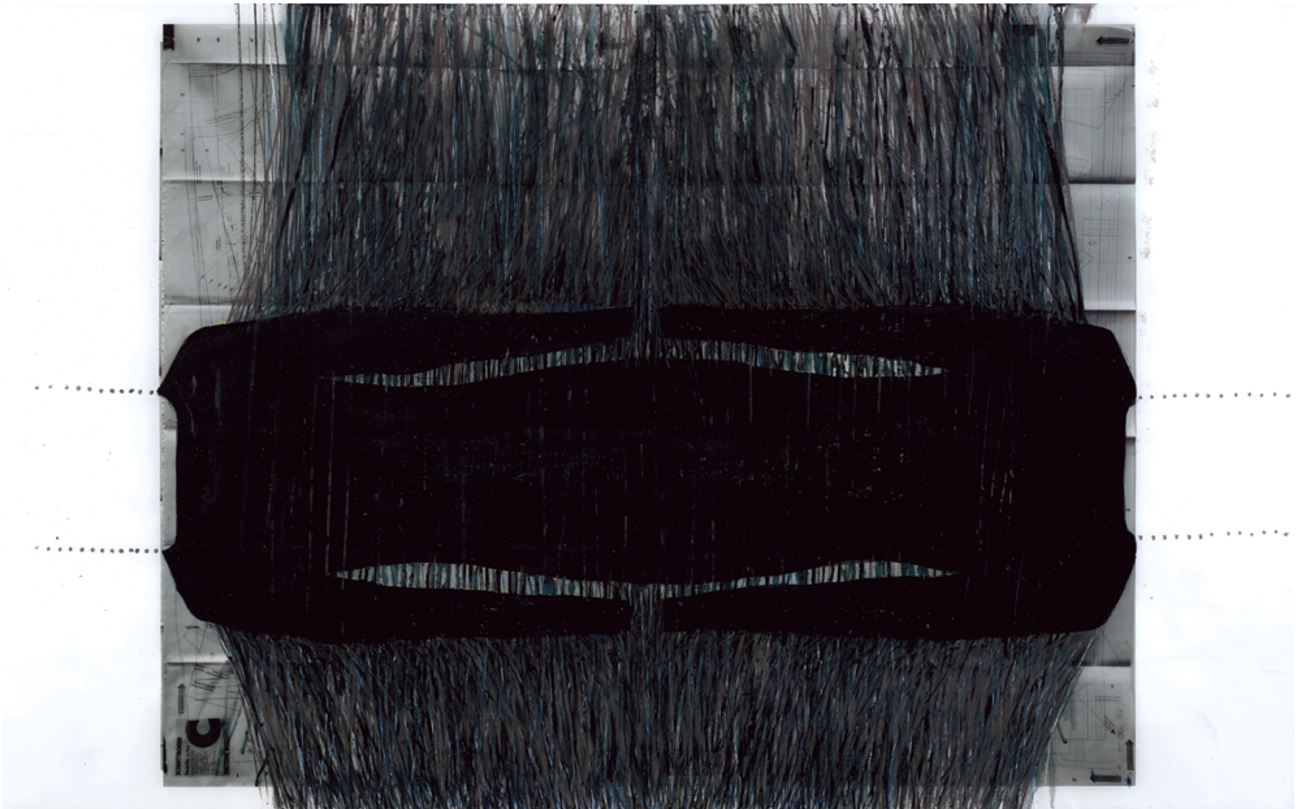
טובה לוטן, אישה נול (2018), מדיה מעורבת על ניר פרגמנט, 130/90 ס"מ Tova Lotan, Woman Loom (2018), mixed media on parchment, 90/130 cm