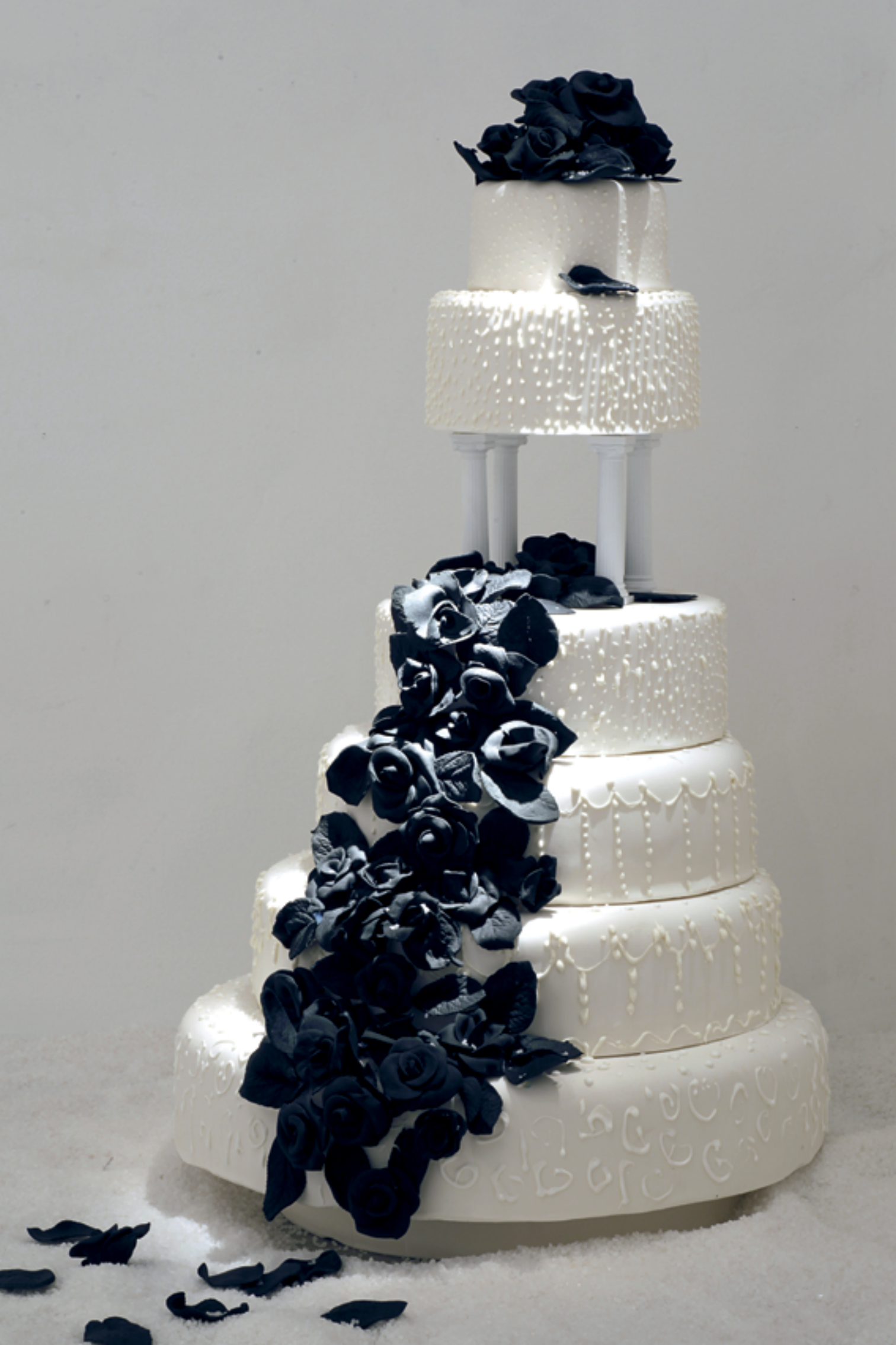
ברכה גיא, עוגת כלולות (2011), בצק סוכר, קלקר, מלח, גובה 65 ס"מ, קוטר 50 ס"מ Bracha Guy, Wedding Cake (2011), sugar dough, styrofoam, salt, height 65 cm, diameter 50 cm