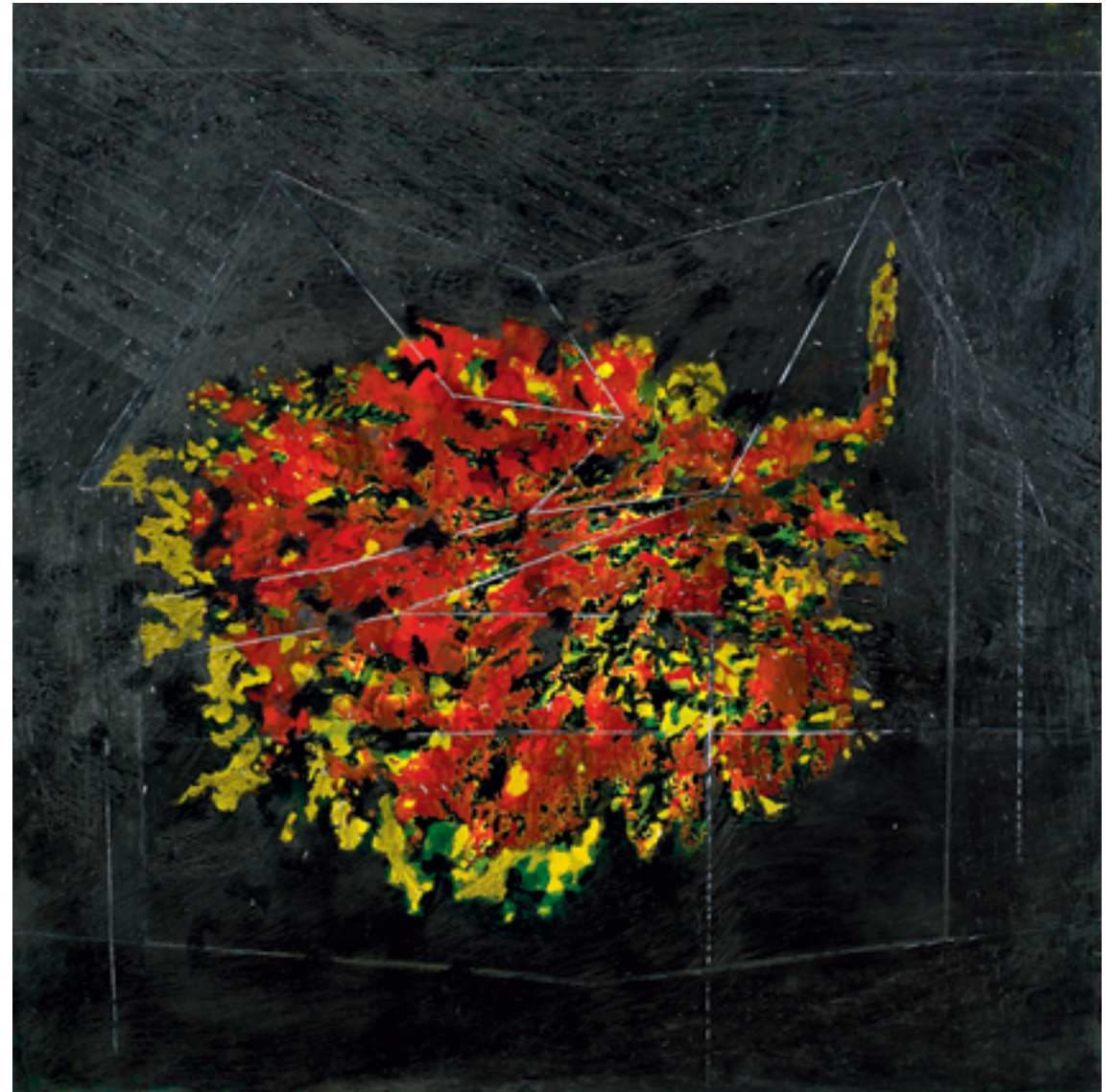
טובה לוטן, להכניס את הצל של העץ הביתה (2015), מדיה מעורבת על נייר, 130/130 ס"מ Tova Lotan, Introducing Tree Shadow to the Interior of the House (2015), mixed media on paper, 130/130 cm