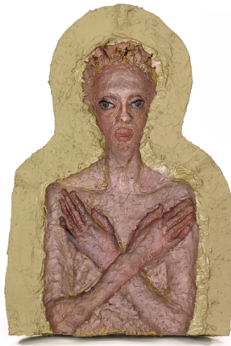
חווה ראוכר, נערה אתיופית סרקופג (2017), שמן על גבס וגומי, גובה 65 ס"מ Hava Raucher, Ethiopian Girl (2017), oil on plaster and rubber, 65 cm