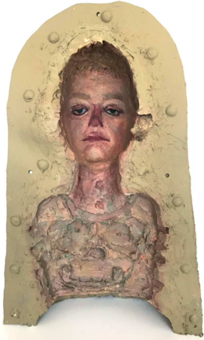
חווה ראוכר, ילד עם מפלצת (2017), שמן על גבס וגומי, גובה 65 ס"מ Hava Raucher, Child with Monster (2017), oil on plaster and rubber, 65 cm