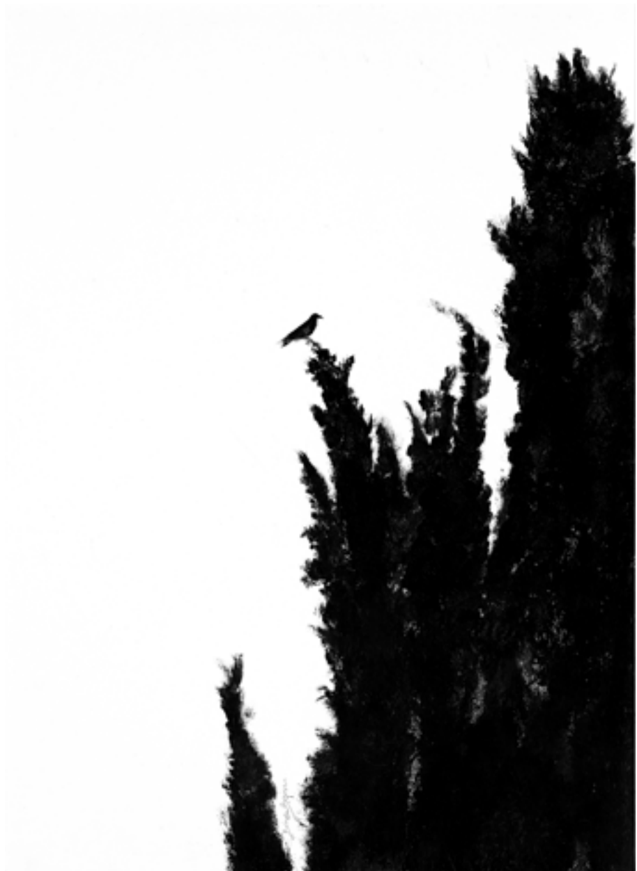
דן בירנבוים, הברוש והעורב (2016), אקריליק על נייר, 50/70 ס"מ Dan Birenboim, The Cypress and the Raven (2016), acrylic on paper, 50/70 cm