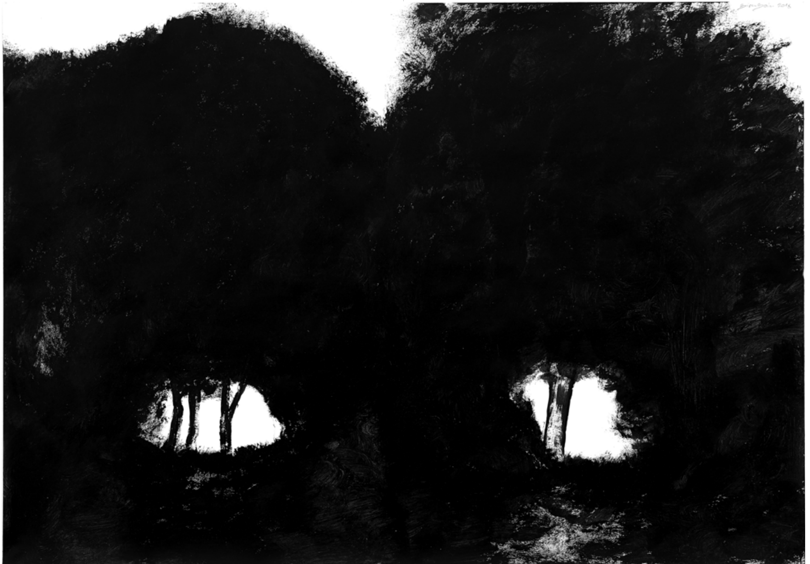
דן בירנבוים, הצמד בשחור (2018), אקריליק על נייר, 70/100 Dan Birenboim, Couple in Black (2018), acrylic on paper, 70/100