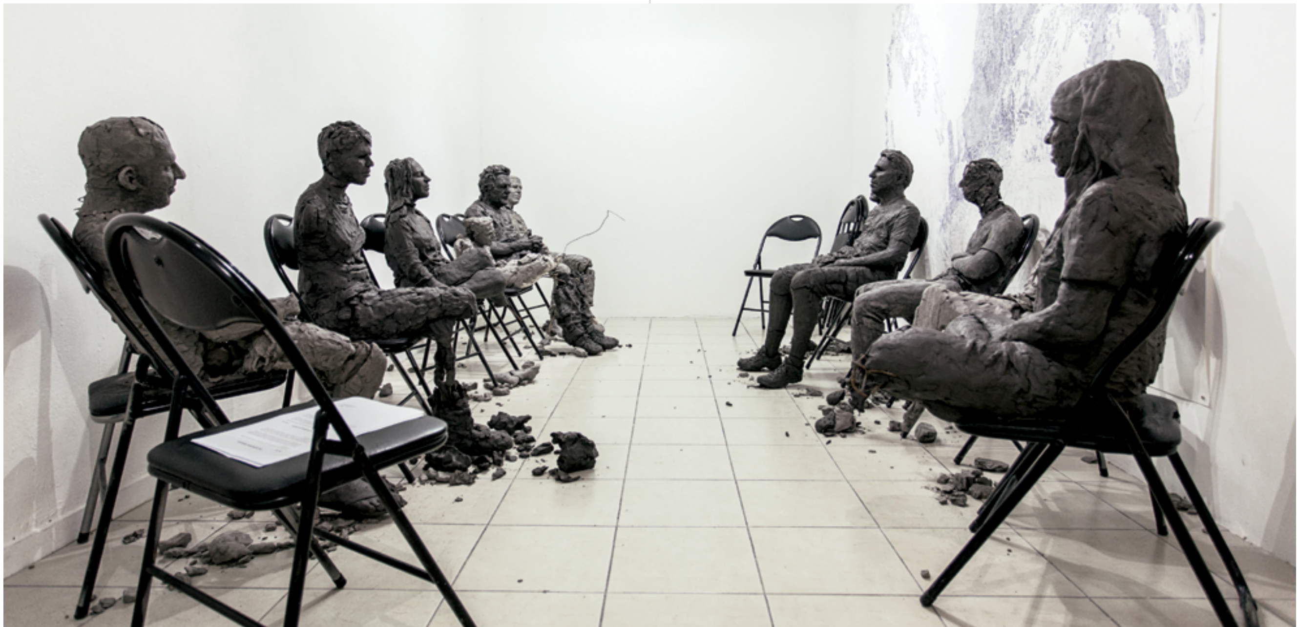
קרן דולין, חיינו הפכו בלתי ניתנים לניהול (2016), אובייקטים, חימה, קונסטרוקציה ממתכת, כיסאות Karin Dolin, Our Life Has Become Unmanageable (2016), objects, clay, metal construction, chairs