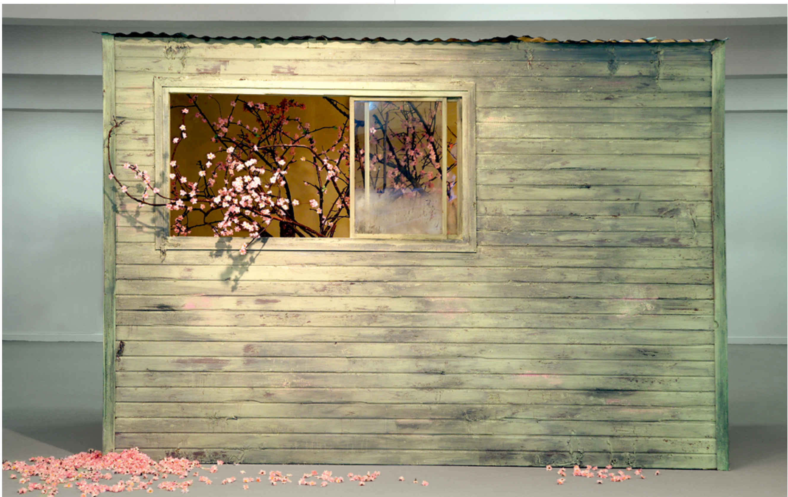
ליהי חן, פריחה שנתאחרה (2006), צילום הצבה Lihi Chen, Late Bloomer (2006), installation view