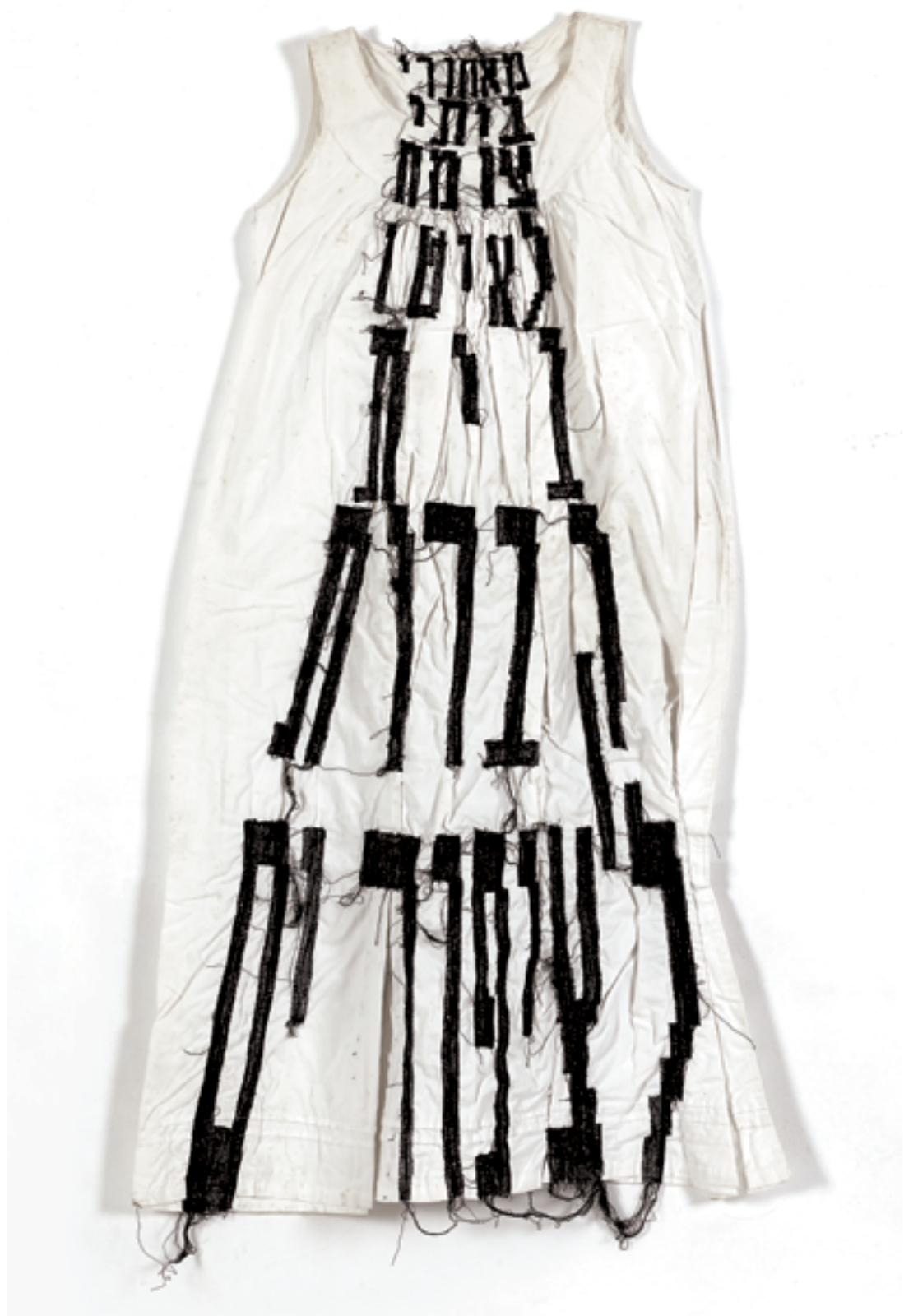
טובה לוטן, מאחורי ביתי (2004), תפירת מכונה על שמלה Tova Lotan, In My Backyard (2004), machine sewing on a dress