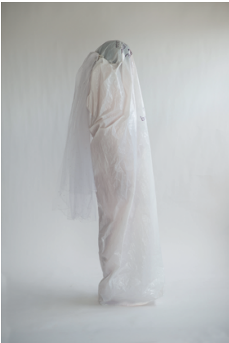
דבי מורג, כלה בשקית ניילון (2017), צילום, 100/70 ס"מ Debbie Morag, Bride in a Nylon Bag (2017), photograph, 70/100 cm

The wind whispered in my ear, / "It's about time for you / To come with me to the other world," / Enticing me with its cloying voice / So I quickly answered, "I will stay here yet a while, / For I still have things / Left to do. / The wind's face looked put out / As it went back where it came from / In an indignant whoosh." 1