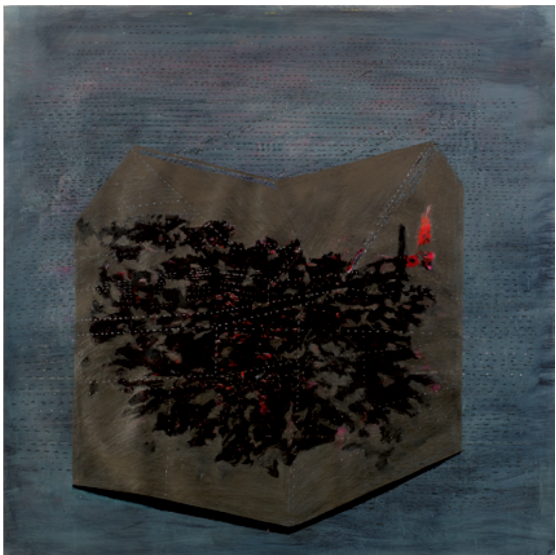
דבי מורג, סדוק (2017), צילום, 100/70 ס"מ Debbie Morag, Cracked (2017), photograph, 70/100 cm