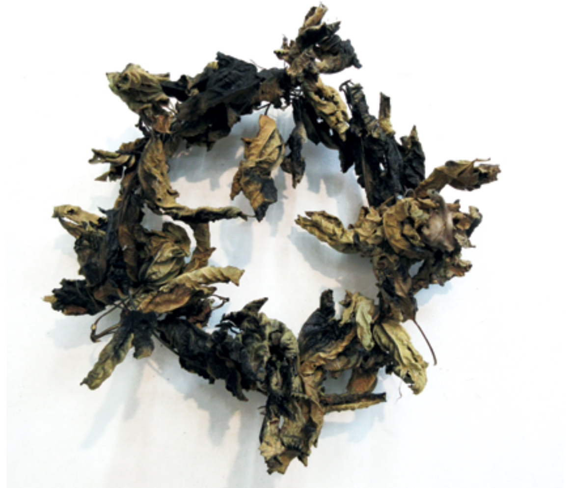
ברכה גיא, זר אבלות (2017), עלי תאנה קמלים, מצופים בשכבת לכה Bracha Guy, Mourning Bouquet (2017), wilted fig tree leaves, coated with lacquer