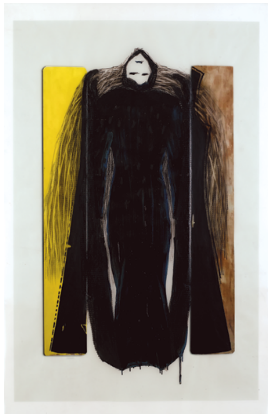
טובה לוטן, ללא כותרת (2017), מהסדרה "מתפרקת ומרכיבה", 90/130 ס"מ Tova Lotan, Untitled (2017), from the series "Disassembling and Rassembling", 90/130 cm